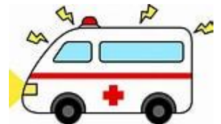
にぎやかサウンド 車を走らせたり、交通音を鳴らしたり・・・