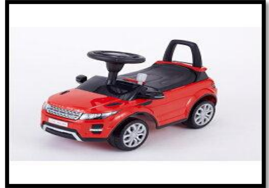
レンジローバーイヴォーク