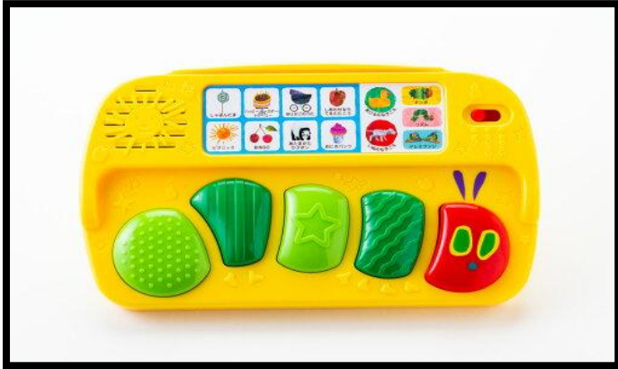
はらぺこあおむし リズム&たいこ